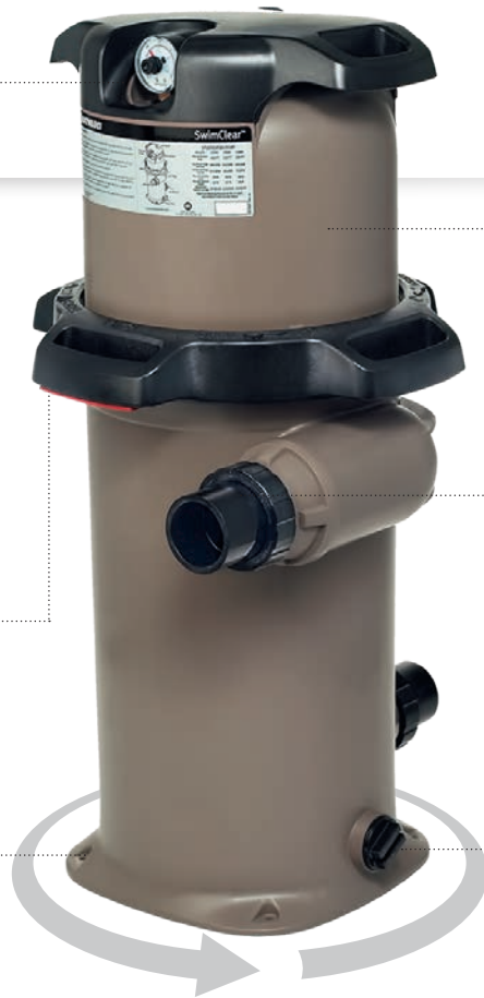
Filtre SwimClear™ mono-élément

Empreinte au sol réduite idéal pour les locaux techniques exigus