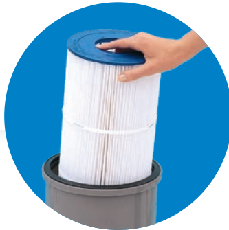
Média filtrant polyester

Unions pour faciliter les opérations d'installation et de remplacement